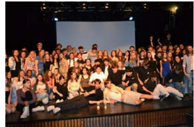
Gala méritas sportif